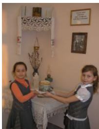
Рис. 2. Готовимся ко Дню Святой Пасхи

духовные и культурные ценности подрастающему поколению, именно культура является средством воспитания глубоко нравственной личности. Точками, где собраны ресурсы развития культурной жизни, залог того, что она не исчезнет для будущих поколений, являются традиционные социальные общественные институты, предназначенные для преобразования, хранения, передачи культурного потенциала, его освоения и использования членами общества. В связи с этим огромная роль отводится Государственным музеям различных профилей и направленностей, а также их младшим братьям - школьным музеям - как форме наиболее мобильной, интерактивной, где все можно потрогать руками, включить в процесс познания тактильное восприятие мира, что так необходимо воспитанникам детского сада и школьникам младшей ступени.