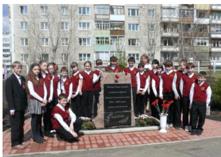
Рис. 4. На открытии памятного камня в честь Героев Советского Союза