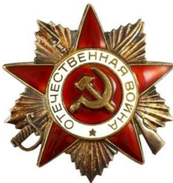
Орден Отечественной войны II степени

покрытой рубиново-красной эмалью на фоне золотых лучей, расходящихся в виде пятиконечной звезды, лучи которой расположены меж концами красной звезды. Посреди красной звезды - золотое изображение серпа и молота на рубиново-красной круглой основе, окаймленной белым эмалевым пояском, с надписью «ОТЕЧЕСТВЕННАЯ ВОЙНА» и с золотой звездочкой в нижней части пояска. Красная звезда и белый поясок имеют золотые ободки. Накладные серп и молот по центру ордена сделаны из золота. На фоне лучей золотой звезды изображены концы винтовки и шашки, скрещенных позади красной звезды. Золотого содержания - 8,329 \pm 0,379 г, серебряного - 16,754 \pm 0,977 г. Общий вес ордена первой степени - 32,34 \pm 1,65 г.